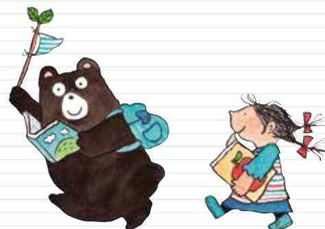
島根県立図書館イメージキャラクター ぶっくまくとしおりちゃん