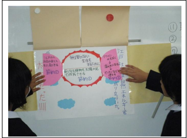
調べたことをきちんと伝えるために、それぞれのグループが工夫を凝らした画用紙を作りました。[発表の様子]