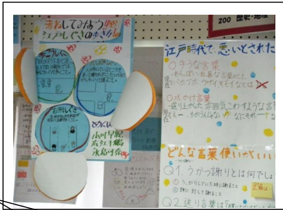
作った画用紙は、全て図書館に掲示