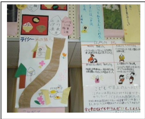
画用紙の裏の付箋は、生徒ひとりひとりの評価