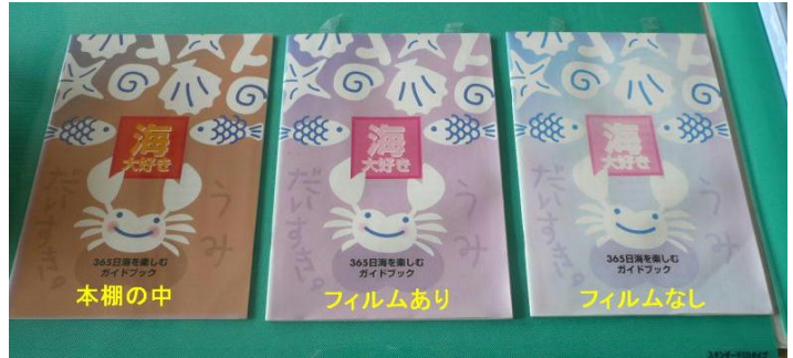
効果の検証実験結果