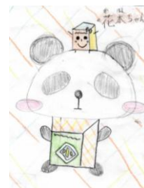
しおさい図書館キャラクター ほんだぼんだ君