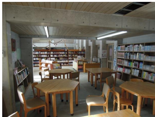
奥の本棚が読み物、手前の本棚が調べ物に分類しました