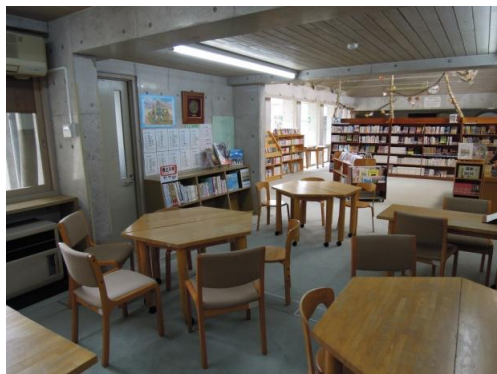
奥を本棚で仕切り、図書館のスペースが広くなりました