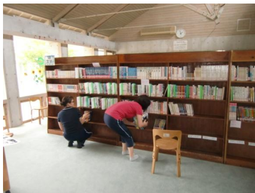
先生方で本を移動しました