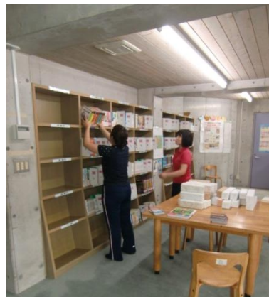
分類ごとにきれいに並べていただきました