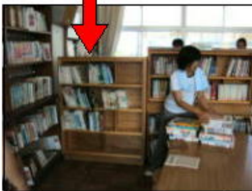
両面書架は畳コーナーの仕切りに。