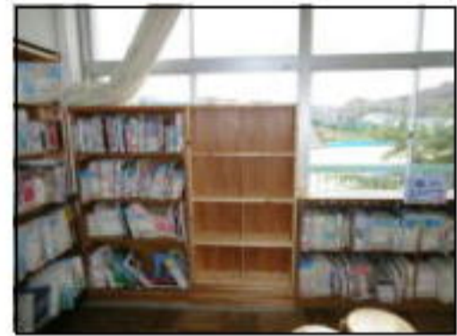
移動した後の隙間にぴったり書架を置きました。