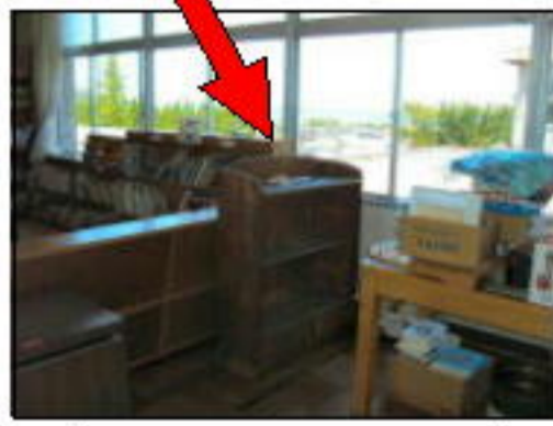
司書のための収納棚に。