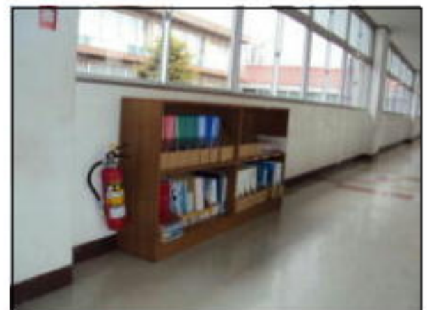
廊下に出した書架はファイルやパンフレットの収納に。