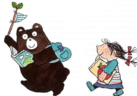
島根県立図書館イメージキャラクター ぶっくまくとしおりちゃん